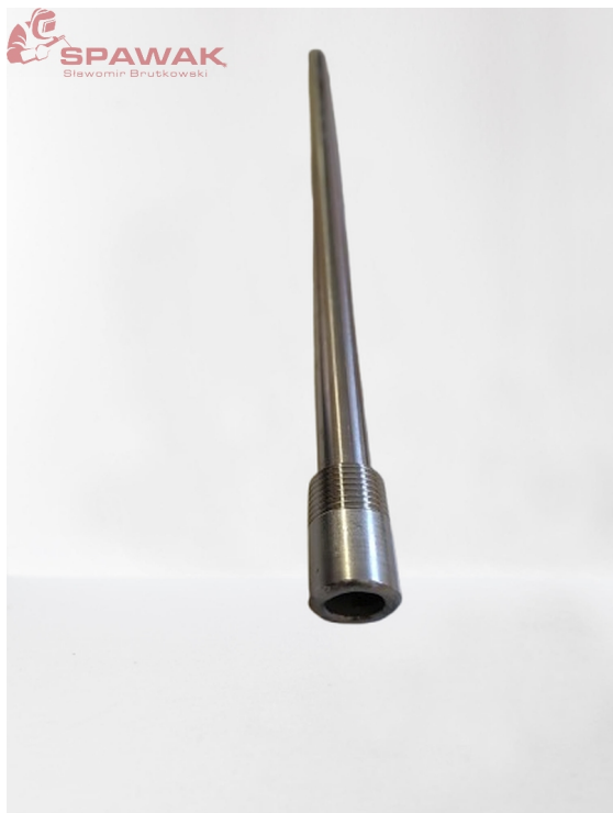
2. Magnezowa anoda ochronna: