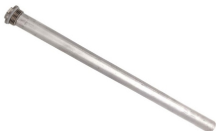
3. Tytanowa anoda ochronna: